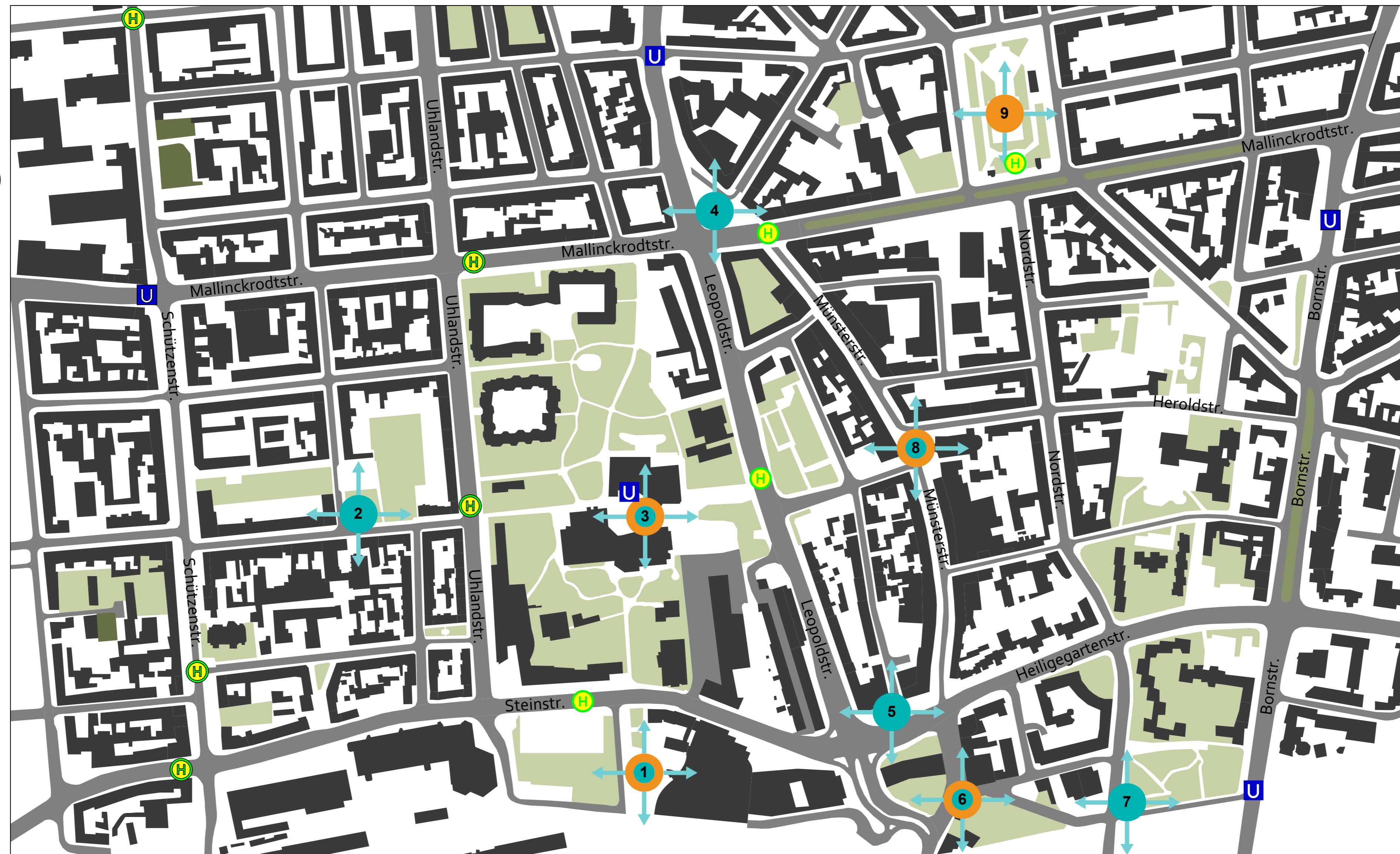
Touren und Standpunkte